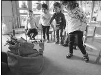
Mit großer Spannung wurden die gefüllten Socken betrachtet.

Anhand einer Bilderbuchbetrachtung konnten die Kinder die Geschichte vom heiligen Nikolaus nachempfinden und erleben und dabei erfahren, warum wir den Nikolaustag feiern. Die Wichtelkinder hörten die Geschichte vom Nikolaus und seinem störrischen Esel, spielten selber den Nikolaus, indem sie mit Nikolausmütze und Sack durch den Kreis liefen und sangen ein Nikolauslied.