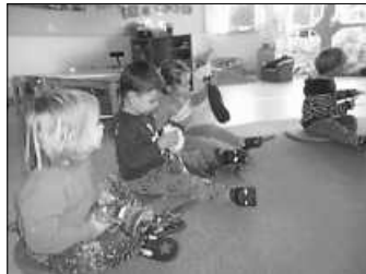
Umso größer war dann natürlich auch die Neugierde beim Auspacken.

Am Ende des Morgenkreises bekam dann endlich jedes Kind seinen gefüllten Socken, so dass es diesen später mit nach Hause nehmen konnte.