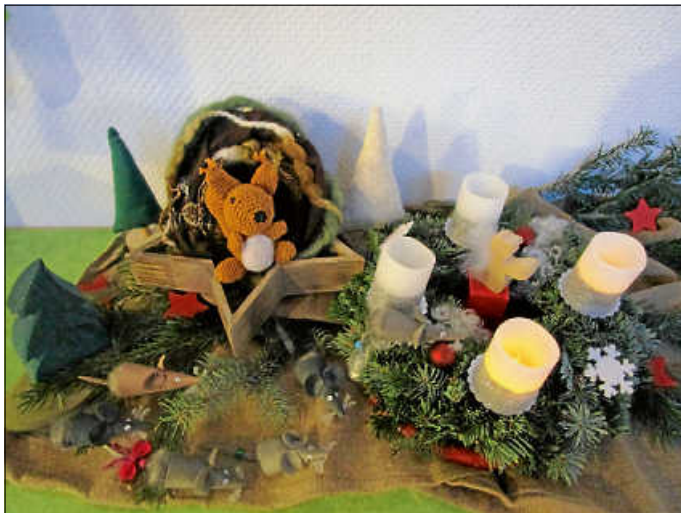
Die Kirchenmäuse und Eichhörnchen Felix, begleiten die Kinder durch die Vorweihnachtszeit.

Lieder wie „Lasst uns froh und munter sein“ und „Stern über Bethlehem“ stehen in der nächsten Zeit ebenso auf dem Programm wie die biblische Weihnachtsgeschichte. In der „Wichtelwerkstatt“ begleitet Felix, das Eichhörnchen die Kinder im Morgenkreis durch die Advents- und Weihnachtszeit. Die Kinder erleben die Geschichte vom Nikolaus und seinem störrischen Esel, und sie hören die Weihnachtsgeschichte, die vor langer Zeit in Bethlehem spielte.