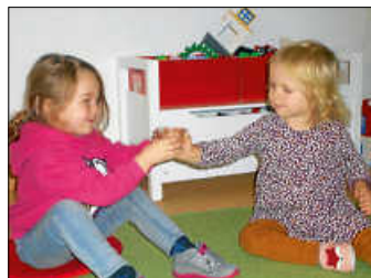
Lichterreise zu den leisen Klängen des Liedverses „Leise, ganz leise“.

Hungrig setzten sich dann alle an den Vespertisch, der an diesem Tag mit den Eichhörnchen-Tischlaternen, die die Kinder selbst gestaltet hatten, dekoriert war. Nach dem Vesper freuten sich alle über die leckeren Schoko-Lebkuchen, die es zum Nachtisch gab.