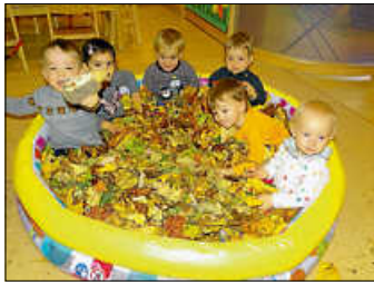
Große Freude bereitete den Kindern die Igelsuche im Blätterhaufen.

Der besondere Vormittag des Lichter- und Laternenfestes begann im Zwergenstübchen dann mit einem Fotoshooting der Kinder und den gebastelten „Igel-Laternen“. Ein großer bunter Blätterhaufen hörte nicht mehr auf zu Rascheln, als die Kinder dort immer wieder miteinander einen „versteckten“ Igel suchten. Das hat allen zusammen großen Spaß bereitet.