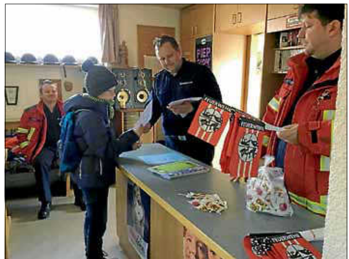
Übergabe der Urkunden