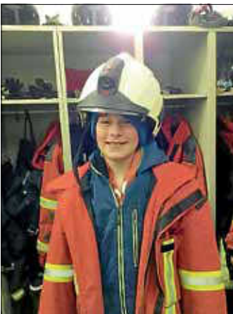
Anprobe der Ausrüstung

Wir waren mit der Klasse 4a und 4b am Montag, den 27.01.2020 bei der Feuerwehr in Egenhausen. Im Sachunterricht behandelten wir gerade das Thema „Feuer“.