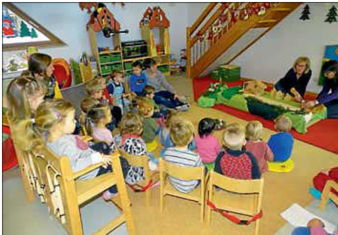
Gespannt lauschen die Kinder der Weihnachtsgeschichte.

Mit diesem, den Kindern bereits bekannten, Lied begann in der Adventszeit der tägliche Morgenkreis in der Kinderkrippe.