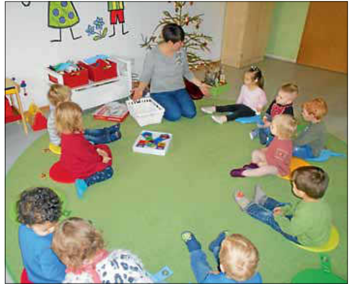
Mit großer Freude werden die Gruppengeschenke ausgepackt.

Die Freude und Spannung waren riesig, als es dann endlich ans Auspacken ging. Auch für die Erzieherinnen immer wieder ein Moment mit ganz besonderer Stimmung, denn hier wird spürbar, wie intensiv die Bindungen im Krippenalltag geknüpft und verknüpft sind.