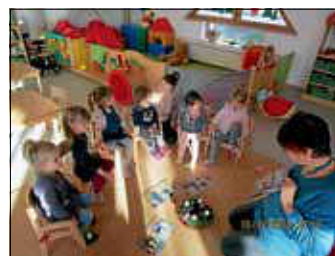
Bilderbuchbetrachtung: die Geschichte vom heiligen Nikolaus.

Am Freitag, den 6.12. lagen die Socken nicht mehr an ihrem Platz. Mit staunenden Augen haben die Kinder diese, gefüllt in einem Weidenkorb und an einer Schnur an der Decke, in den Gruppenräumen entdeckt.