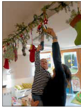
gespannt erhielt jedes Kind seine gefüllte Socke.

In den letzten Tagen gab jede Familie für ihr Kind eine Kindersocke ab. Immer wieder haben die Kinder ihre Socke angeschaut und gespannt gewartet, was mit dieser nun geschieht.