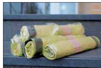
Gelbe Säcke werden in Egenhausen verteilt.

In Egenhausen werden am 25.11.2019 Gelbe Säcke verteilt. An diesem Tag finden dann auch die Gelbe Sack-Abfuhr und die Leerung der Gelben Tonnen statt. Verantwortlich für die Verteilung ist die von der Duales System Deutschland GmbH beauftragte Firma REMONDIS. Gelbe Säcke erhalten nur Haushalte und Gewerbebetriebe, die keine Gelbe Tonne