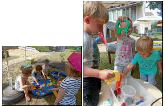
Spannend ging es auf den Spuren von Magnetismus im Forscherbereich zu.

Auf den Spuren von Magnetismus und den Schwerkraften konnte im Forscherbereich getüftelt und experimentiert werden.