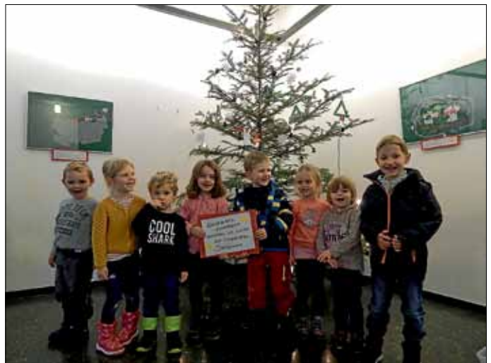
Unser geschmückter Tannenbaum

Auch der Schmuck des Tannenbaums wurde von den Kindern gebastelt. Der Baum erstrahlt nun im Rathaus mit Schneemännern, Sternen, Glitzerbäumen, Zuckerstangen und Salzteiganhängern.