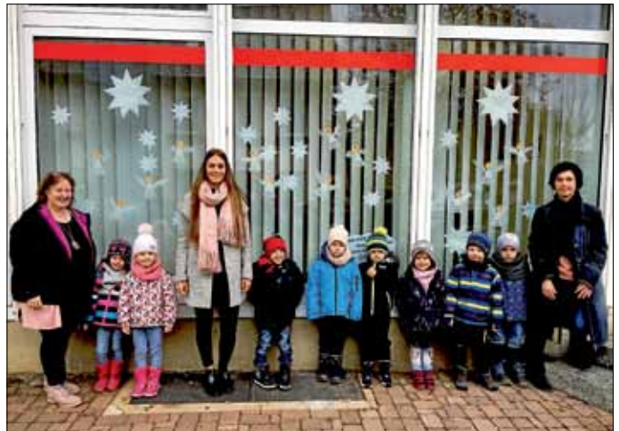
Unser geschmücktes Fenster

Für die Sparkasse in Egenhausen haben die Kinder Sterne und Engel gebastelt, die sie dann zur Bank gebracht haben und gemeinsam aufgehängt haben.