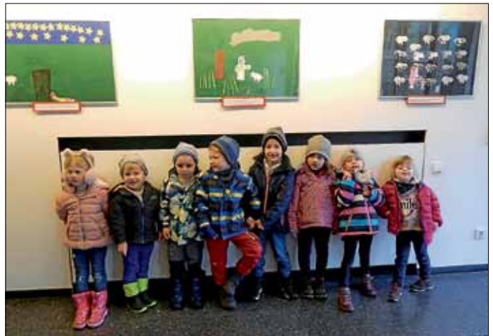
Die Geschichte des Hirten Simon

Zur Geschichte des Hirten Simon haben die Kinder aus unterschiedlichen Materialien Bilder gebastelt und diese dann im Rathaus aufgehängt.