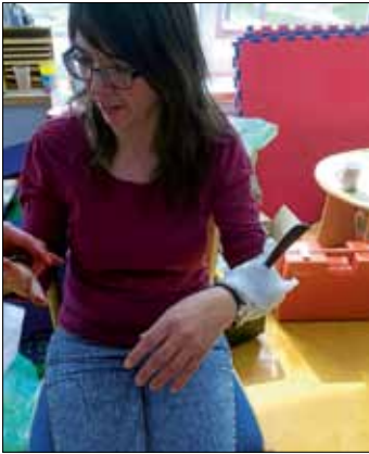
Es ging gefährlich zu

Besonders realistisch wurden einige „Unfälle“ mit (Kunst)-Blut nachgestellt. Da musste dann ein Patient mit abgetrenntem Finger, ein Patient mit einem Messer im Arm oder ein Patient mit einer blutenden Wunde versorgt und verbunden werden. Aber auch diese „Unfälle“ konnten bewältigt werden, die wir aber hoffentlich im Krippen- und Kindergartenalltag nicht erleben werden.