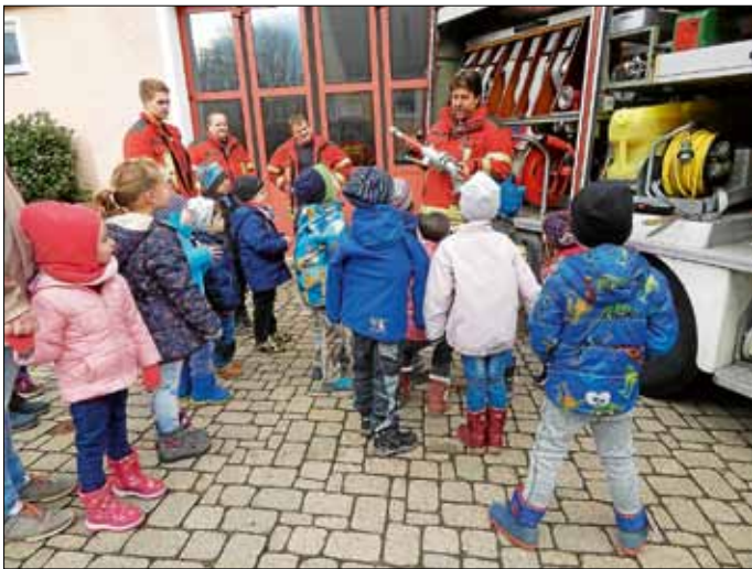
Bei der Feuerwehr

Vielen Dank auch nochmal an die Feuerwehrmänner, die uns diesen tollen Besuch ermöglicht haben.