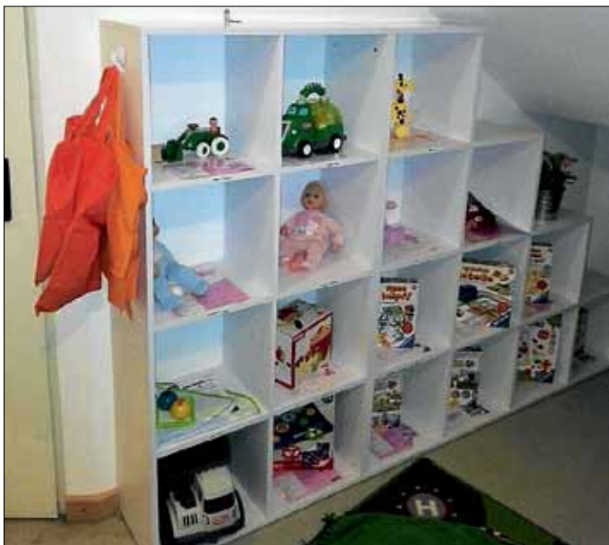
Die verschiedenen Spielzeuge können ab sofort von den Familien ausgeliehen werden.

Im vergangenen Jahr bewarb sich die Kinderkrippe auf die Initiative der „KiTa-Spielothek für die Krippe“ des Vereins „mehr Zeit für Kinder“. Glücklicherweise gewannen die Wunderkinder ein umfangreiches Spielwarenpaket für die Erstellung einer Spielothek. Die KiTa-Spielothek basiert, wie eine Bibliothek, auf einem Ausleihsystem.