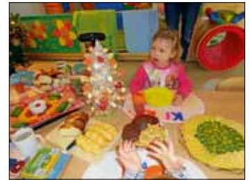
Die Wunderkinder ließen sich das von den Eltern zusammengestellte Buffet schmecken.

Auch ein Geschenk für die Eltern durfte natürlich nicht fehlen. Die Kinder überreichten am Ende des Krippentages ihren Eltern selbstverzierte Lebkuchen in Form eines Weihnachtsbaumes.