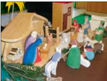
Ein Tischtheater erzählte die Weihnachtsgeschichte.

Es wurde gemeinsam gesungen, musiziert und geklatscht. Gespannt lauschten die Kinder danach der Weihnachtsgeschichte, welche anschaulich mit Figuren und Szenenbildern von den Erzieherinnen nachgespielt wurde. Wie der „schönste“ Weihnachtsbaum aussehen sollte, erzählten die Kinder anhand eines Fingerspiels.