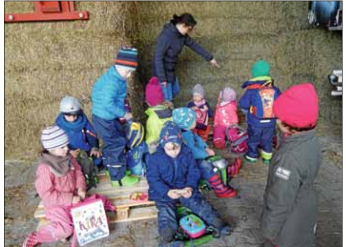
Stärkung bei der Schatzsuche

Es war eine Schatzkarte. Damit wir den Schatz aber finden konnten, mussten die Kinder unterwegs einige Aufgaben erfüllen, wie z.B. ein Hindernisfahren, Lieder von Tieren singen, und Wettrennen. Und natürlich mussten die ganzen Umschläge mit den Hinweisen gefunden werden.