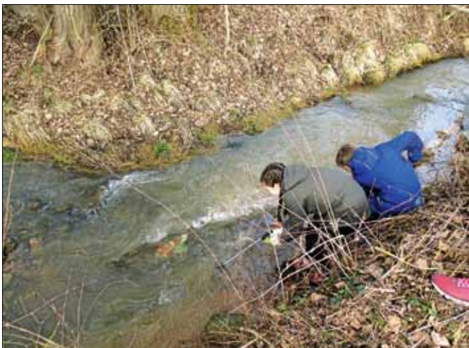
„Mit vollem Einsatz“