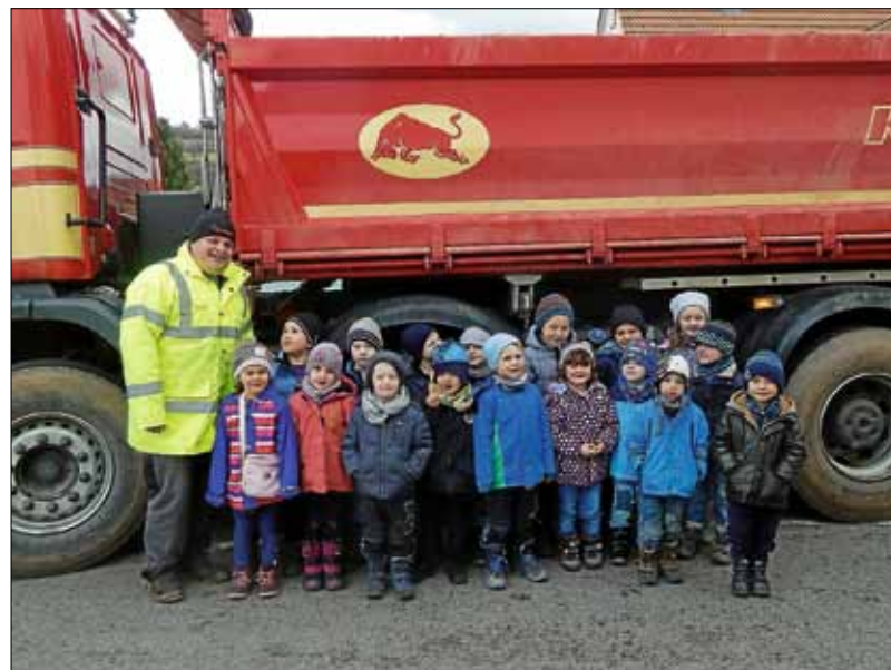
So ein großer LKW

In den letzten zwei Wochen hatten wir Berufe, die mit Fahrzeugen zu tun hatten. Ein Papa besuchte uns mit seinem LKW der Spedition Kirn. Wir schauten uns den LKW ganz genau an, zählten alle Reifen und jedes Kind durfte einmal auf den Fahrersitz klettern und sich ganz wie ein/e LKW-Fahrer/in fühlen.