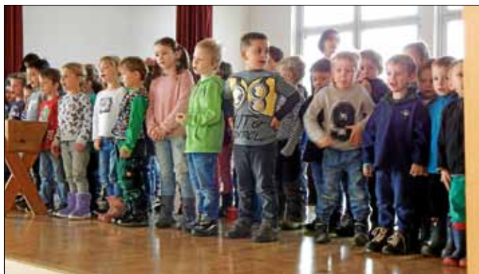
Beim Üben für den Gottesdienst

Am Sonntag, 27. November, dem 1. Advent, läuteten wir mit einem Gottesdienst in der Silberdistelhalle die Advents- und Weihnachtszeit ein. Alle Kinder und Eltern des Kindergartens trafen sich in der Silberdistelhalle und lauschten dem seit Wochen einstudierten Vorspiel und den erlernten Liedern der Kindergartenkinder. Dabei wurde deutlich, wie wichtig es ist, im ganzen Weihnachtstrubel um Christbäume schmücken, Plätzchen backen oder Geschenke besorgen nicht den eigentlichen Grund des Festes zu vergessen, nämlich die Geburt Jesu.