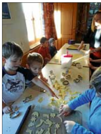
Auch im Waldkindergarten wird gebacken

Am 6. Dezember besuchte der Nikolaus das Spatzennest & die Waldstrolche und ließ sich von gelernten Liedern und Gedichten beeindruckt. Daraufhin durfte jedes Kind ein Geschenk aus seinem großen Sack mit strahlenden Augen entgegennehmen.