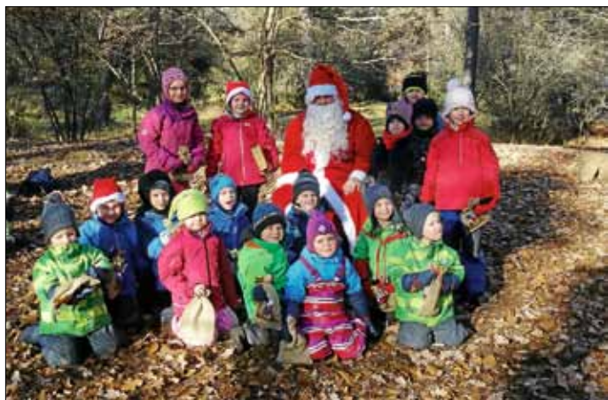
Besuch vom Nikolaus

Der Abschluss der Adventszeit fand dann am letzten Tag vor den Ferien, dem 22. Dezember, statt. Nach einem leckeren Frühstück bekam jedes Kind sein Weihnachtsgeschenk und durfte später selbstgemachte Pflaumenmarmelade als Geschenk seinen Eltern überreichen, die in den Kindergarten zu Punsch und Plätzchen eingeladen waren.