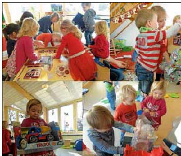
Beim Geschenke auspacken

Nachdem die neuen Gruppengeschenke bestaunt und sofort ausprobiert wurden, lud ein leckeres Buffet zum Weihnachtsschmaus ein. Der Vormittag verflieg wie im Flug und mit von den Kindern selbsthergestellten Geschenken für ihre Eltern, verabschiedeten die Erzieherinnen ihre Schützlinge in die Weihnachtsferien.